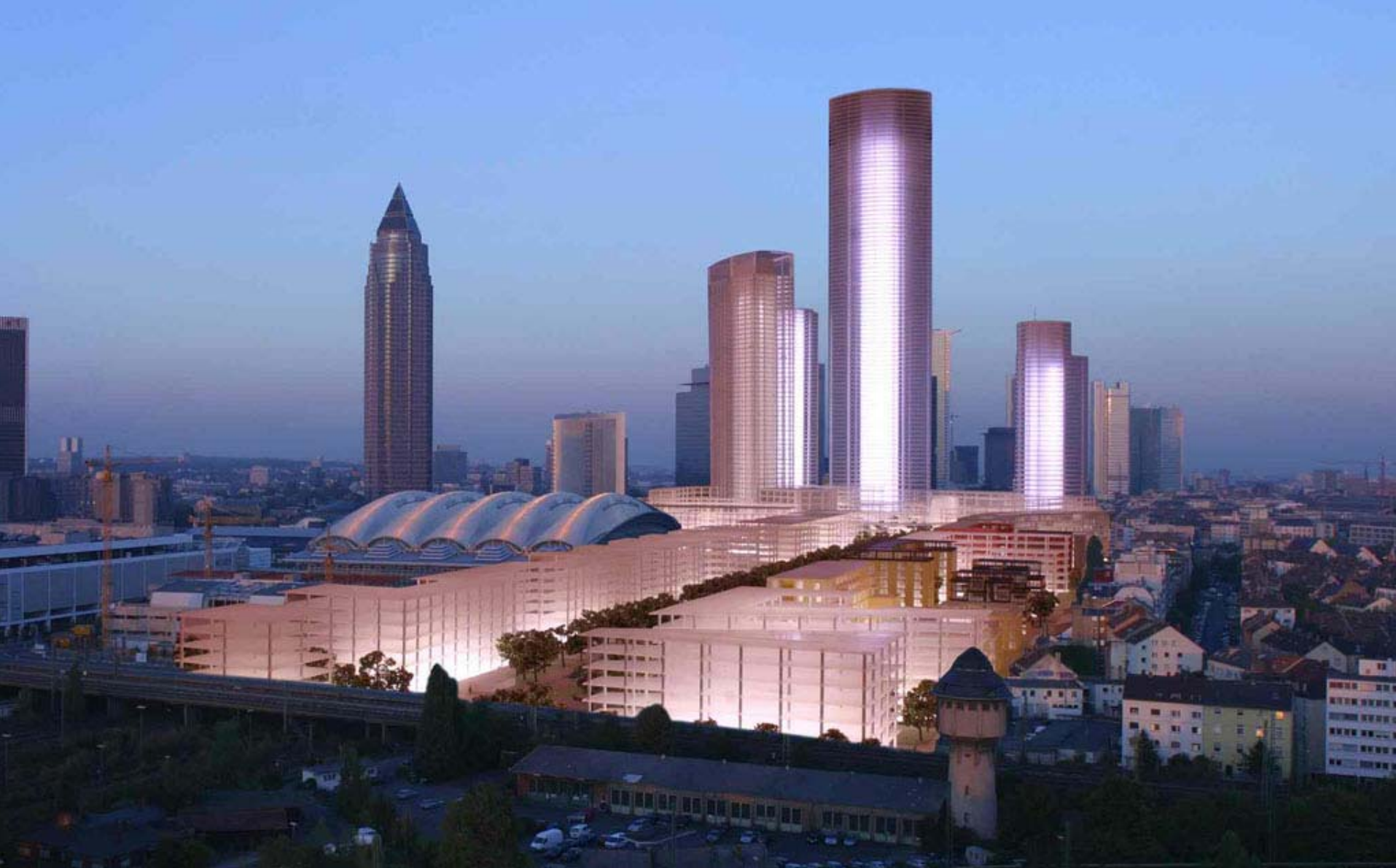
Europa Boulevard met hoogbouw: Urban Entertainment Center